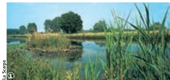
① La Scarpe