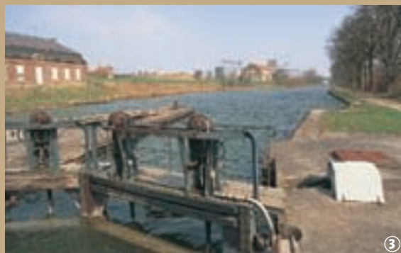
③ Ecluse sur l'Escaut