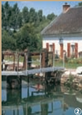
② Ecluse sur l'Escaut