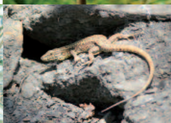
Léopard des murailles