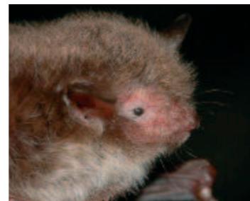
Murin de Daubenton