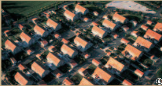
Corons aux environs d'Arenberg.