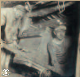
Mines de Carvin, Octobre 1902.

Aujourd'hui, les mineurs ont disparu ; il ne reste que les musées ou les cités en rénovation pour évoquer leur mémoire et leur rendre hommage. Grâce au film de Claude Berry, Germinal , tourné à Wallers, ce noble métier est passé, après Zola une seconde fois à la postérité, sans oublier le classement en monument historique de nombreux terrils.