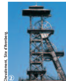
Chevalement, Site d'Arenberg.

Circuit accessible à tous, toute l'année. Entre campagne, cité minière et villages, découvrez un site historique que l'association des Amis de Germinal , créée par d'anciens mineurs, vous fera visiter (sur rendez-vous au 03.27.35.61.61). En effet, le carreau de fosse de Wallers Arenberg a gardé toute son authenticité et certains décors du film « Germinal » sont encore visibles.